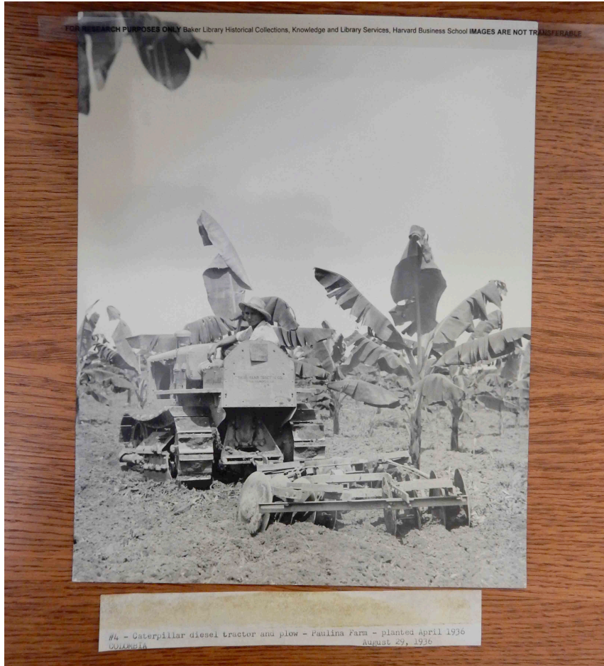
Fig. 18. "Caterpillar Diesel Tractor and Plow – Paulina Farm – Planted, April 1936. August 29, 1936."