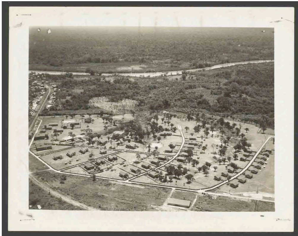
Harvard University, Baker Library, Harvard Business School, W719719_1