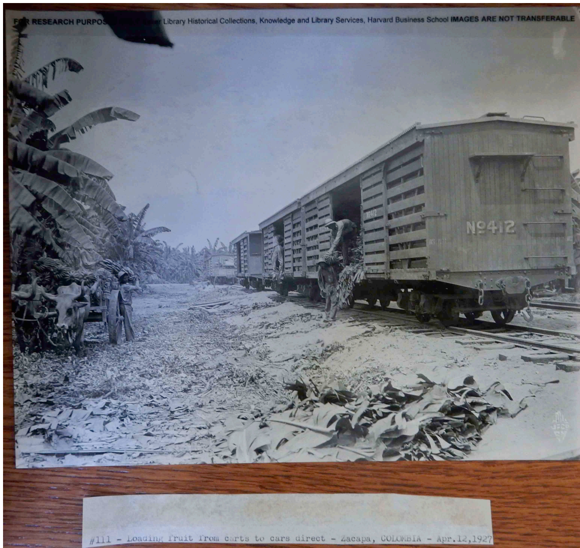
Fig. 22. “Loading Fruit from Carts to Cars Direct – Zacapa, Colombia – Apr. 12, 1927.”

Al tiempo que la fotografía en cuestión está a la mano como standing reserve , la instrumentalización capitalista y militar de las fotografías en general, que con su mirada lo penetran todo, desde lo más amplio hasta lo más minúsculo, participan no sólo del proceso de transformar todo en standing reserve , sino en enemigo. Los hombres que aquí descargan los racimos son enemigos en potencia.