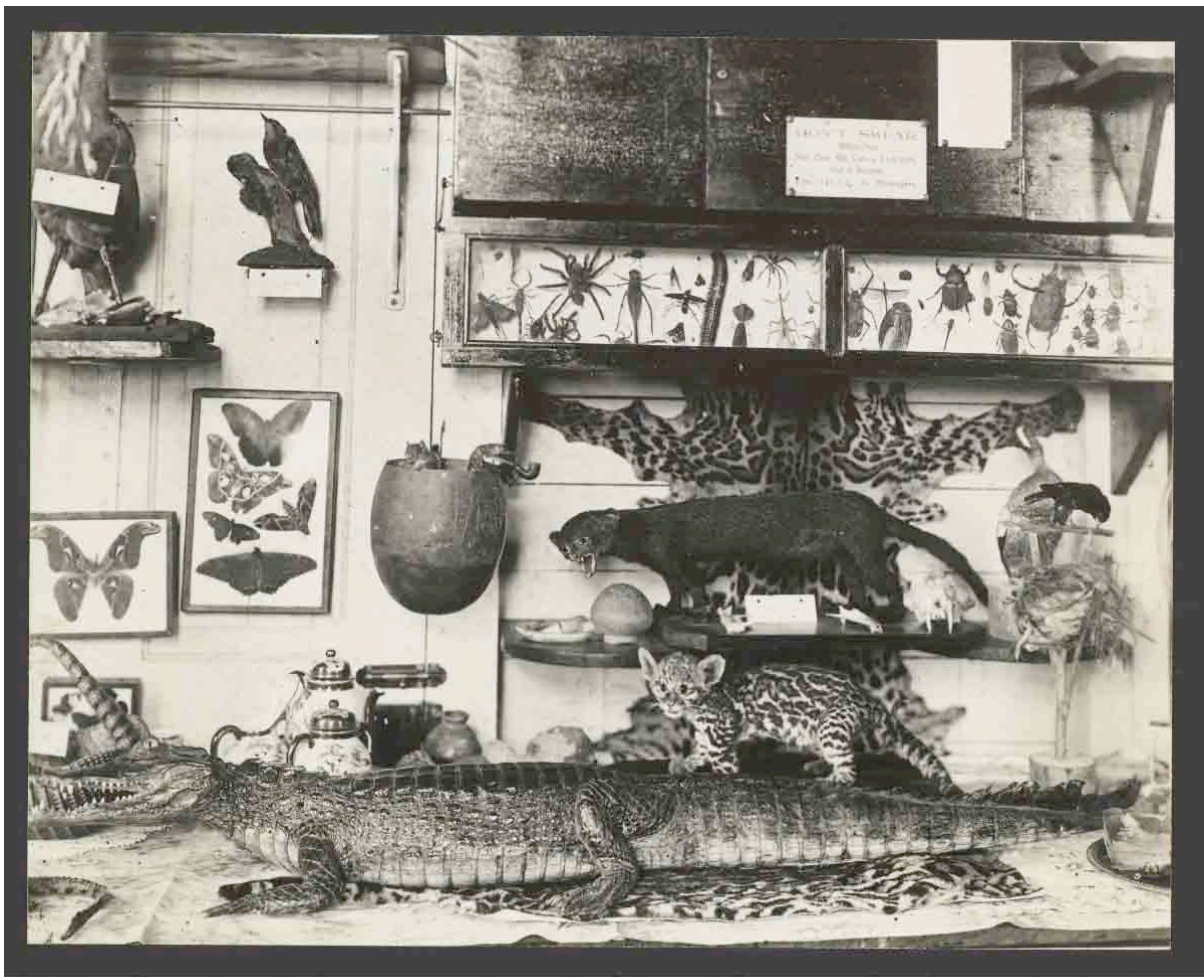
Harvard University, Baker Library, Harvard Business School, W719699_1

Las fotografías aéreas de la United Fruit Company no son empleadas para combatir de manera directa una guerra interestatal, al menos no las imágenes que son de acceso público, pero junto con las otras imágenes del archivo público participan de una forma bélica y científica de aprehender el mundo que conserva los mismos lineamientos: reconocer, cartografiar, vigilar y anticipar. Hacen parte de una manera específica de preguntarse por el mundo y entenderlo como depósito de materias primas. En otras palabras, se trata de la materialización del deseo de la era moderna por dominar la naturaleza, clasificarla e inventariarla (Fig. 26).