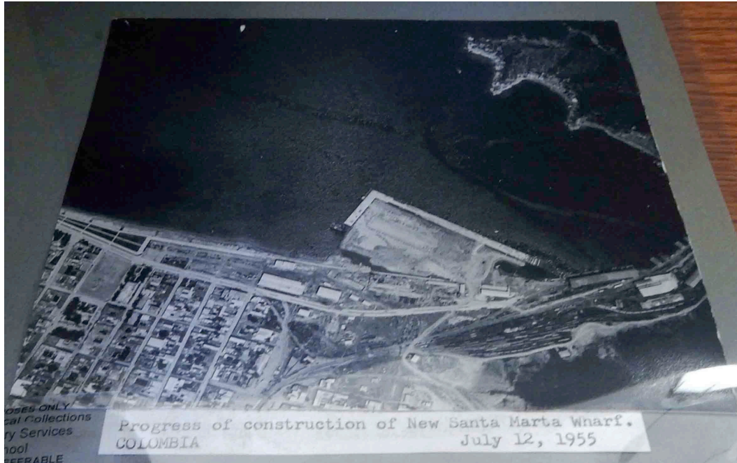
Fig. 23. "Progress of construction of New Santa Marta Wharf. July 12, 1955."