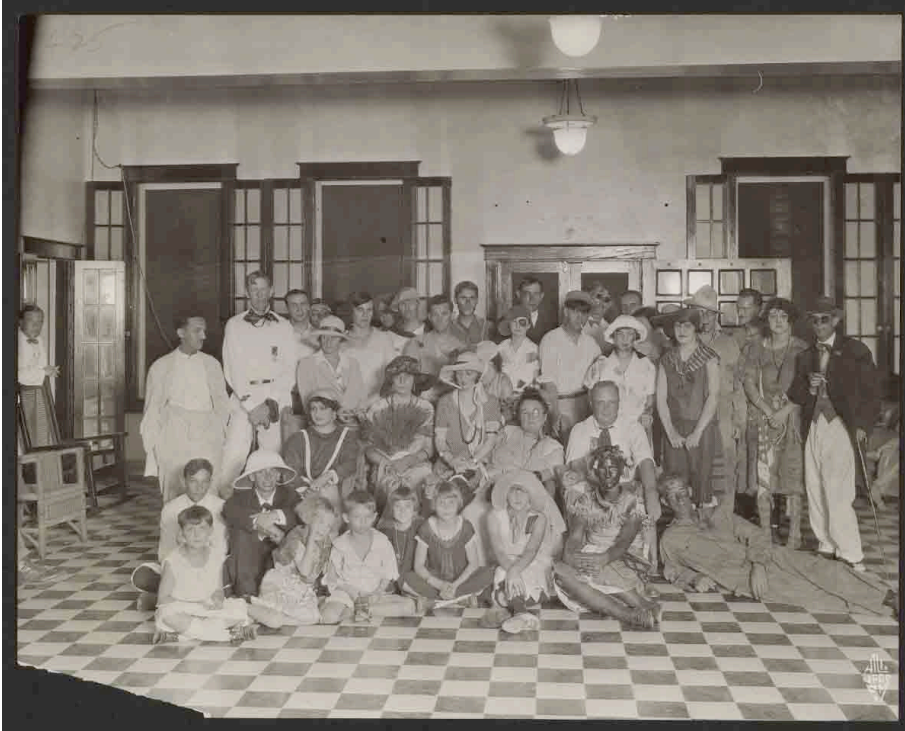
Harvard University, Baker Library, Harvard Business School, W713810_1