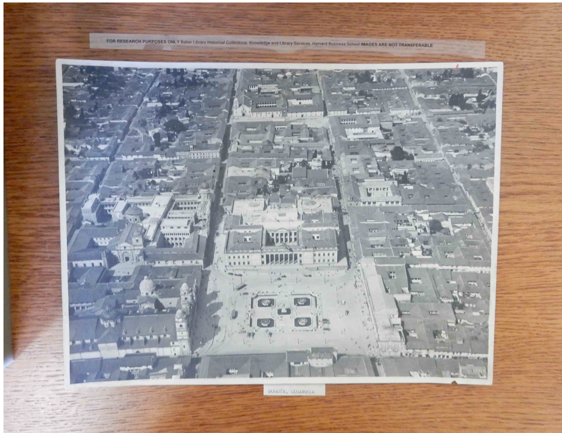
Fig. 25. “Bogota, Colombia. Aerial,” (entre los años 1926 y 1948).

Schmitt dice que en el momento en que se agrega la dimensión del espacio a la relación entre las dimensiones de la tierra y el mar todo cambia, en especial el modo en que se lucha la guerra y se define la relación amigo-enemigo. Si el conflicto se caracteriza en el primero por la ocupación y el establecimiento de un orden (para la explotación del territorio), y en el segundo por la adquisición del botín y el bloqueo comercial, en la dimensión aérea, que se instaura desde la Primera Guerra Mundial, no hay posibilidad de relación alguna entre seres humanos. Por lo tanto, el enemigo se desdibuja y sólo queda la posibilidad de la destrucción ( El nomos de... 418-425). Y la fotografía no es ajena a esto. La distancia considerable que hay entre una imagen aérea y el índice referencial permite un “anonymous view [that] facilitates the will to power and the delivery of a dehumanised, abstracted view that makes killing easier and more efficient [...]