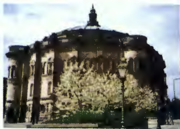
エディンバラ大学(英国)

400年の伝統をもつ英国の名門総合大学。スコットランドの首都エディンバラにあり、特に大学院は国内外からの学生に高いレベルの研究の場を与えています。