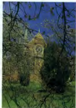
ケンブリッジ大学ホマトン校(英国)

1963年創立。5学部からなる、学問的水準の高い総合大学。オックスフォード、ケンブリッジにつぐ大学のひとつと考えられています。