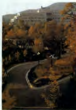
梨花女子大学(韓国)

18世紀の創設。教員養成等実績があり、海外交流を活発に行なうなど、ケンブリッジ大学の中でも意欲的なコレッジ。駅の近くに美しい広大な敷地があります。